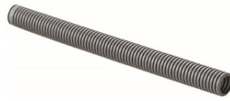
ケーブル保護チューブ